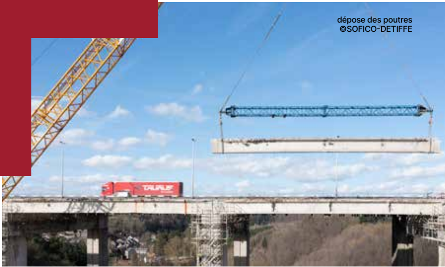
dépose des poutres

lang het aantal afgelegde kilometers, het gewicht en de verontreinigende uitstoot van zijn of haar voertuig. SOFICO int maandelijks gemiddeld 23 miljoen euro via de kilometerheffing voor vrachtwagens, die opnieuw wordt geïnvesteerd in het herstel en het onderhoud van het infrastructuurnetwerk. Dit is de belangrijkste bron van inkomsten voor SOFICO, dat ook op andere verkeersinkomsten kan rekenen: de 'shadow toll', die door het Waalse Gewest wordt betaald voor rekening van de gebruikers van het structurerend netwerk, of een tol die door het Waalse Gewest wordt betaald voor de terbeschikkingstelling van grote kunstwerken op de Waalse waterwegen, in functie van het gebruik van deze infrastructuur.