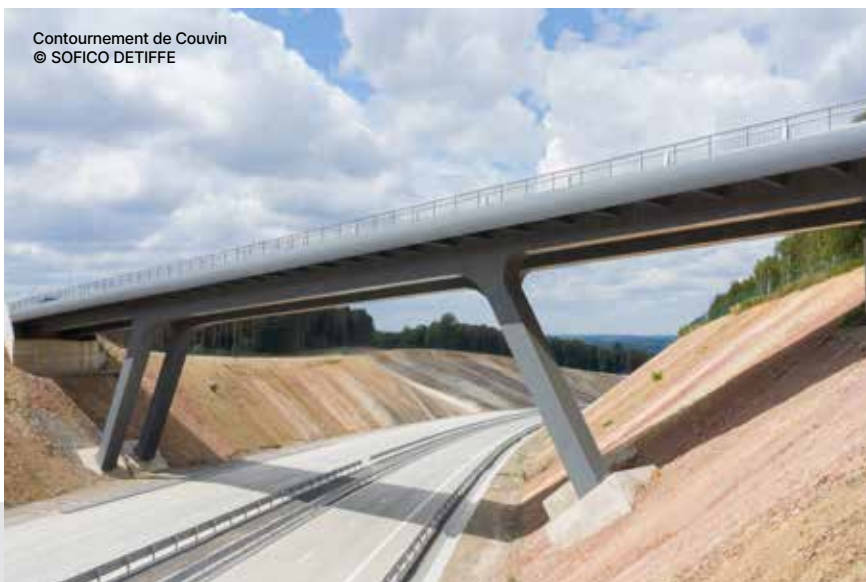
Contournement de Couvin

Over het algemeen noteert SOFICO een groei van de bedrijfsopbrengsten, waardoor de winst van het boekjaar is gestegen tot 38,3 miljoen euro op 31 december 2021, tegenover 0,9 miljoen euro aan het einde van het jaar voordien. De financiële gezondheid van SOFICO is uitstekend en weerspiegelt het zorgvuldige en strikte beheer. In de tussentijd heeft de onderneming investeringen gedaan voor een totaalbedrag van 132,1 miljoen euro. Dit bekrachtigt de rol en het belang van SOFICO voor de Waalse mobiliteit en economie. ■