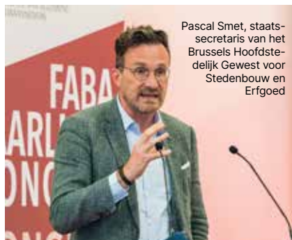
Pascal Smet, staatssecretaris van het Brussels Hoofdstedelijk Gewest voor Stedenbouw en Erfgoed

De Beroepsvereniging van de Vastgoedsector (BVS), de Federatie van Ontwikkelaars-Woningbouwers (FOW) en de Federatie van Algemene Bouwaannemers (Faba) sloegen daarom de handen in elkaar en lanceerden het debat op het Faba-congres dat plaatsvond op woensdag 25 maart op Batibouw, met als centrale thema 'Omgevingsvergunningen 2.0: De weg naar een vereenvoudigde, gedigitaliseerde en snelle(re) procedure.'