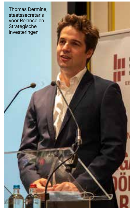
Thomas Dermine, staatssecretaris voor Relance en Strategische Investeringen

gebouwen en patrimonium moeten investeren in duurzaamheid. Tot slot zijn er de bedrijven en de industrie, die moeten streven naar duurzamere productieprocessen en CO 2 -neutraliteit", besluit Kris Luckx. ■